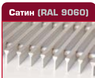
Сатин (RAL 9060)