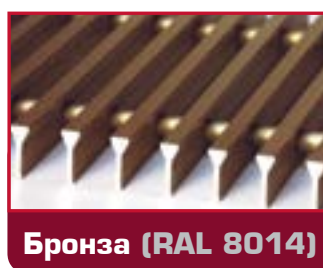
Бронза (RAL 8014)

Возможна покраска решеток в любой цвет RAL.